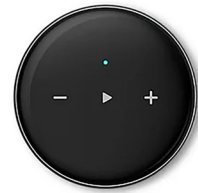
WiiM WM Multiroom